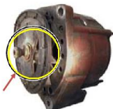
Brak koła pasowego (dotyczy referencji z kołami)