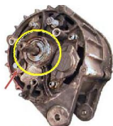
Brak pompy (dotyczy referencji z pompani)