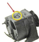
Uszkodzenia mechaniczne obudowy

BRAK USZKODZEŃ – rdzeń nie może posiadać uszkodzeń mechanicznych.