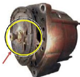
Brak koła pasowego (dotyczy referencji z kołami)