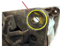
Wybite otwory mocujące (otwory owalne)