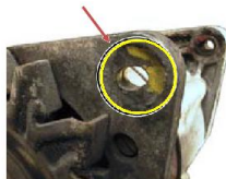
Wybite otwory mocujące (otwory owalne)