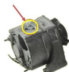
Uszkodzenia mechaniczne obudowy

BRAK USZKODZEŃ – rdzeń nie może posiadać uszkodzeń mechanicznych.